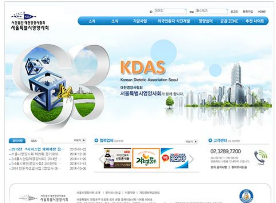
URL http://www.seoulkda.or.kr CLIENT 서울시영양사회