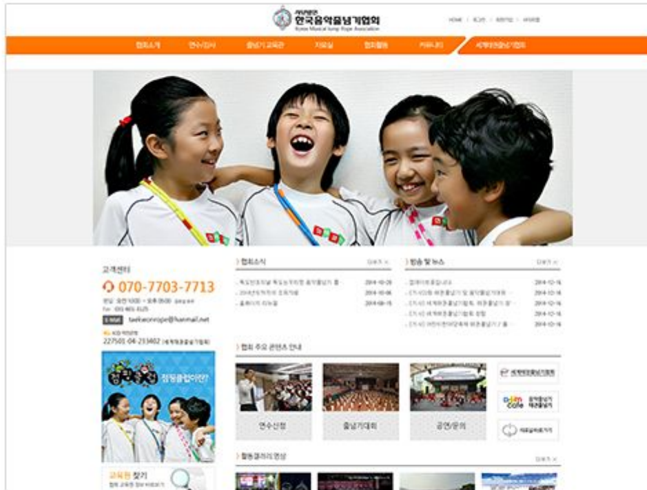
URL http://www.musicrope.com CLIENT 한국음악줄넘기협회