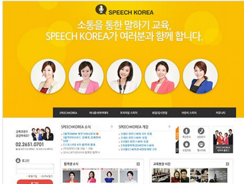
URL http://speechkorea.co.kr CLIENT 스피치코리아